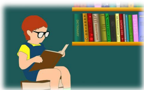
ภาพที่ 2 ข้อมูล (TH SarabunPSK 14 ตัวหนา)