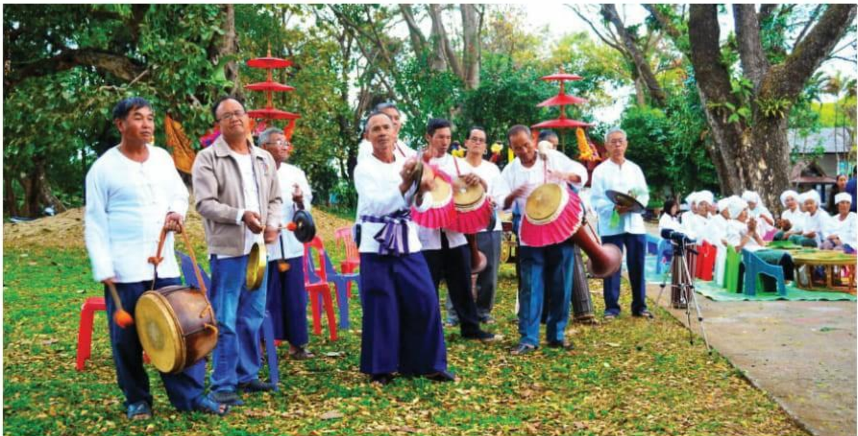
ภาพที่ 3 วงกลองสิ่งหม้องไทยอง ที่มา : องอาจ อินทนิเวศ

กลองตัด 1 ใบ ฉาบ 2 คู่ (ขนาดใหญ่ เล็ก) ซ้อง 3 ลูก (ขนาดใหญ่ กลาง เล็ก) วงกลองสิ่งหม้อง เป็นวงที่ใช้ประกอบการขบวนแห่เพื่อนำงานประเพณี ทางวัฒนธรรม การจัดกลุ่มเครื่องดนตรีโดยมากมักยืมบรรเลงเครื่องชนิดเดียวกัน ใกล้เคียงกันเป็นกลุ่ม เช่น กลองสิ่งหม้อง ก็จะยืมบรรเลงใกล้เคียง ส่วนฉาบ โหม่ง และ กลองตัด ก็ยืมใกล้เคียงกันเป็นกลุ่มเช่นเดียวกัน ทั้งนี้หากเป็นการแสดงบรรเลง ประกอบ