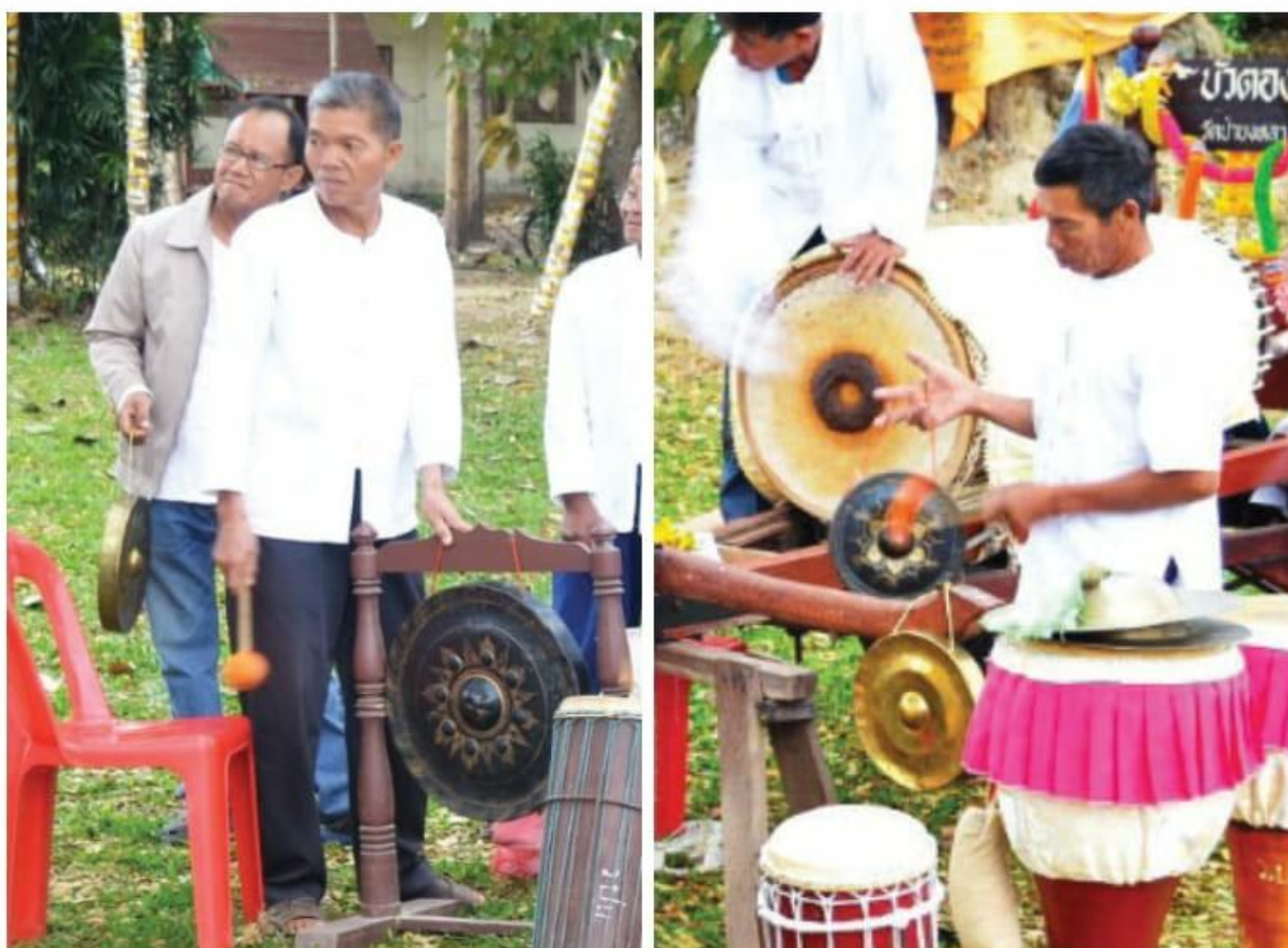
ภาพที่ 11 ฆ้องขนาดใหญ่ ขนาดกลาง (สีทอง) และขนาดเล็ก

ฆ้อง จัดอยู่ในเครื่องดนตรีตระกูลเครื่องเคาะ (idiophone) เป็นเครื่องดนตรีที่ใช้บรรเลงร่วม ในการแสดงของวงดนตรีไทยของทุกลักษณะวงโดยฆ้องที่ใช้จะแบ่งเป็น 3 ขนาด ใหญ่ กลาง เล็ก โดยฆ้องลูกใหญ่ จะมีขาตั้งแขวนฆ้อง ส่วน ขนาดกลาง และเล็ก ใช้เชือกร้อยที่ตัวเครื่องสำหรับใช้ถือ