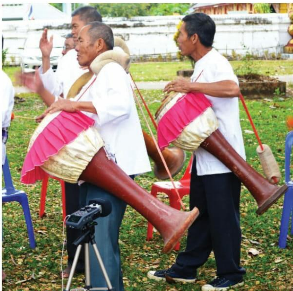
ภาพที่ 8 กลองสั่งหม่อง

กลองสั่งหม่อง เป็นเครื่องดนตรีที่มีระดับเสียงไม่คงที่ แต่ให้ใช้วิธีการคาดคะเนเสียงที่ดัง และหน้ากลองที่มีความตึงได้ระดับตามที่ต้องการ วิธีการบรรเลงกลองสั่งหม่อง ผู้บรรเลงจะคล้องสายสะพายกลองไว้ที่บ่าข้างใดข้างหนึ่ง การตีกลองจะตีด้วยฝ่ามือ หรือปลายนิ้วมือ ทั้งสองข้างที่บริเวณหน้ากลอง