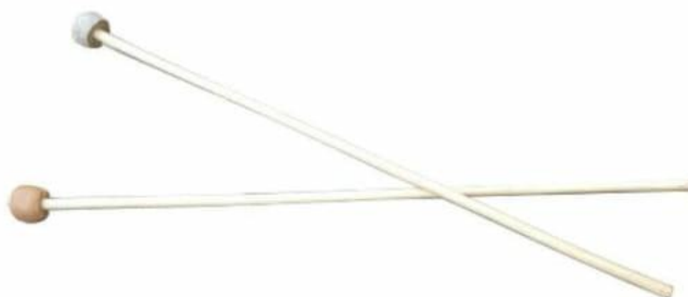
ภาพที่ 7 ไม้ตีกลองตะหลดปด ที่มา : องอาจ อินทนิเวศ