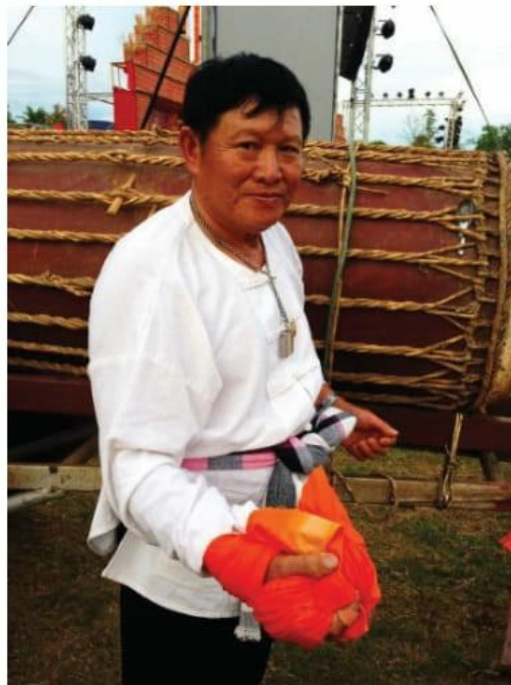
ภาพที่ 5 การตีจากกลอง และการพันมือตีกลองหลวง