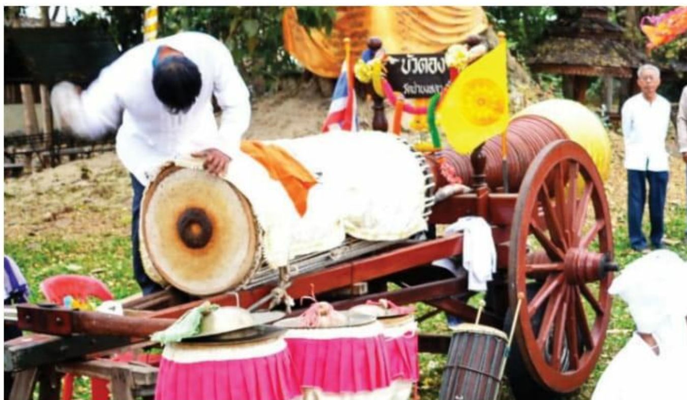
ภาพที่ 2 การขึ้นคร่อมบนรถลากเพื่อตีกลองหลวง

รูปแบบการจัดวางเครื่องดนตรีในวงกลองหลวงไทยของนิยมตั้งกลองหลวงไว้หลังสุด ส่วนฉาบ โหม่งไว้ข้างใดข้างหนึ่ง และกลองตะหลดปดไว้ด้านตรงข้ามกับกลุ่มเครื่องดนตรีฉาบ โหม่ง ทั้งนี้โดยปกติแล้วไม่กำหนดรูปแบบการตำแหน่งเครื่องดนตรี อาจมีการสลับตำแหน่งได้ในลักษณะยืนเป็นกลุ่มเครื่องดนตรี ซึ่งสามารถมองเห็นและได้ยินเสียงเครื่องดนตรีซึ่งกันและกันได้สะดวก แต่ที่สำคัญ คือ กลองหลวงต้องอยู่กลาง และต้องให้ผู้ชมสามารถมองเห็นหน้ากลองและลีลาท่าทางการตีกลองหลวงได้อย่างชัดเจน