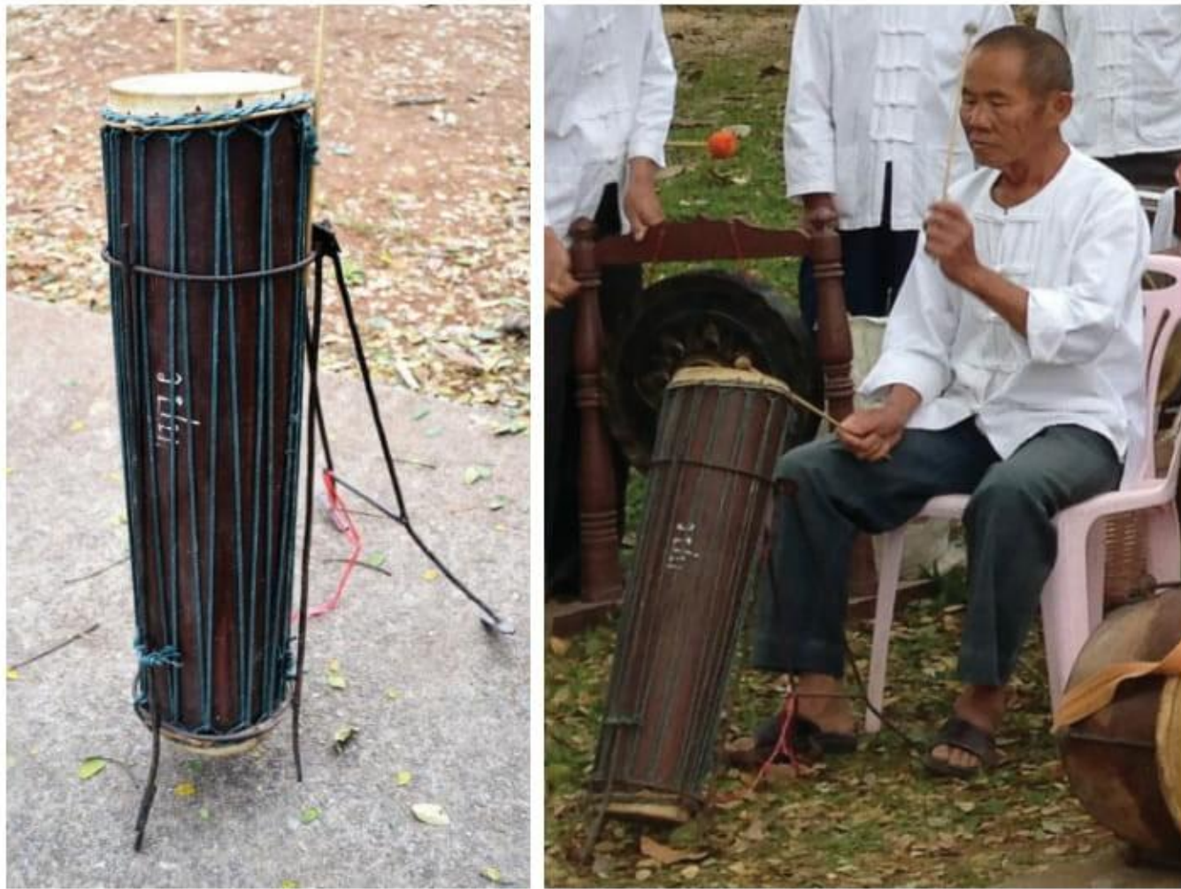
ภาพที่ 6 กลองตะหลดปด และลักษณะทำนองบรรเลง

กลองตะหลดปด มีขนาดเส้นผ่าศูนย์กลาง ส่วนหน้ากลอง ประมาณ 20 เซนติเมตร หน้าส่วนก้นกลอง ประมาณ 16 เซนติเมตร ความยาวเครื่อง 60 เซนติเมตร