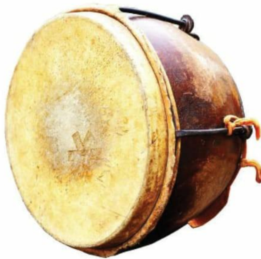
ภาพที่ 9 กลองตัด

ตั้งเสียงกลอง การตีจะมีไม้พันหัวด้วยผ้าสำหรับตีกลองตัดมีขนาดหน้ากว้าง ประมาณ 45 เซนติเมตร ด้านก้นกลองส่วนที่ไม่ปิดหนัง กว้างประมาณ 38 เซนติเมตร ตัวเครื่องยาว ประมาณ 30 เซนติเมตร