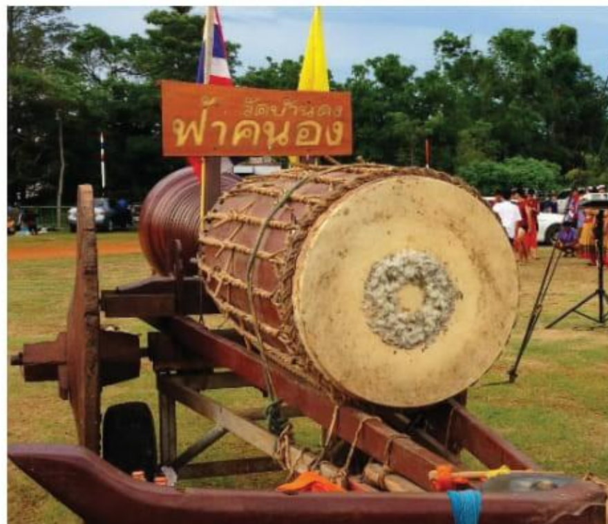
ภาพที่ 4 กลองหลวงไทยของ “แม่บัวตอง” และ “แม่ฟ้าคนอง”

ระบบเสียงของกลองหลวง เป็นเครื่องดนตรีที่มีระดับเสียงไม่แน่นอน ใช้การวัดเสียงจากความดังกังวานเป็นหลัก ดังตามที่นิยมในการประกวดกลองหลวง จะใช้วิธีการวัดความดังจากการตีด้วยมือที่พันผ้า โดยวัดกันที่ความดังกังวานของเสียงที่เกิดขึ้น มีเกณฑ์วัดความดังของเสียงโดยใช้เครื่องวัดที่มีค่าแสดงเป็นค่าเดซิเบล (Decibel, dB) นอกจากนี้ทักษะของผู้ตียังเป็นส่วนสำคัญในการตีเพื่อสร้างเสียงให้ได้ตามเกณฑ์กำหนด และให้คุณภาพเสียงที่ดัง วิธีการบรรเลงหรือการตีกลองหลวงไทยอง ผู้ตีจะต้องใช้ผ้าดิบ หรือ ผ้าจิวร หรือผ้าบางทั่วไป