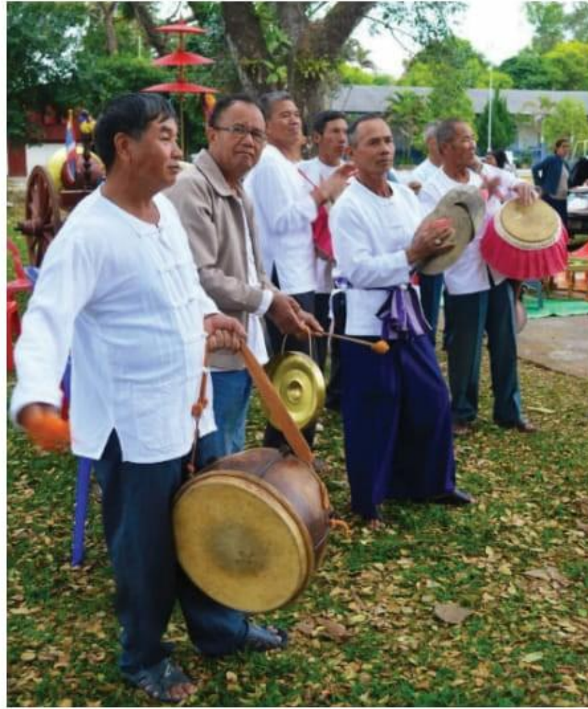
ภาพที่ 10 การตีกลองตัด