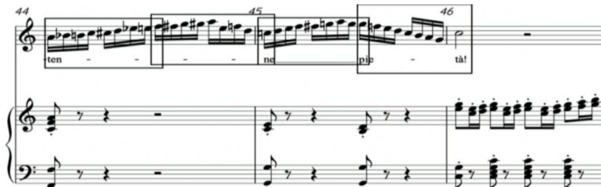
ตัวอย่างที่ 1 บทเพลง เอ็คโครีเต็นเตอินเซโล ห้องที่ 44-46

2.2 กระบวนการเปล่งเสียง จากการศึกษาทั้งสองบทเพลงมีเทคนิค ที่ค่อนข้างแตกต่างกัน ซึ่งเป็นจุดเด่นที่จะสร้างเอกลักษณ์ให้ในแต่ละบทเพลงสามารถ ถ่ายทอดออกมาได้อย่างไพเราะ โดยในบทเพลง เอ็คโครีเต็นเตอินเซโล มีการใช้โน้ตวิ่ง ในจังหวะที่เร็ว รวมถึงมีการกระโดดของเสียง จึงควรให้ความสำคัญกับการฝึกซ้อม สเกลโดยให้ความสำคัญกับโน้ตทุกตัวอย่างเท่าเทียม และฝึกให้เสียงมีความคล่องตัว โดยใช้เนื้อเสียงที่ไม่หนักจนเกินไป เพื่อให้เสียงสามารถเดินทางได้อย่างสะดวกว่องไว ผ่านลมหายใจที่ต่อเนื่อง โดยสามารถเริ่มต้นการฝึกซ้อมจากการแบ่งกลุ่มโน้ตออกมา เป็นส่วนย่อย ๆ และฝึกซ้อมในจังหวะที่ช้าลงจากจังหวะจริง เพื่อให้เกิดความคุ้นชิน กับแนวทำนอง เมื่อร้องทุก ๆ โน้ตได้อย่างแม่นยำจึงเพิ่มความเร็วขึ้นจนเท่ากับอัตรา จังหวะจริงของบทเพลง (ตัวอย่างที่ 1)