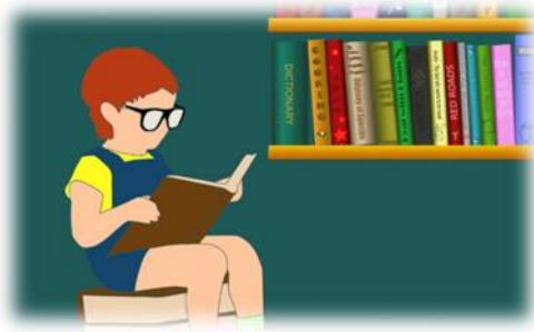
ภาพที่ 2 ข้อมูล (TH SarabunPSK 14 ตัวหนา)