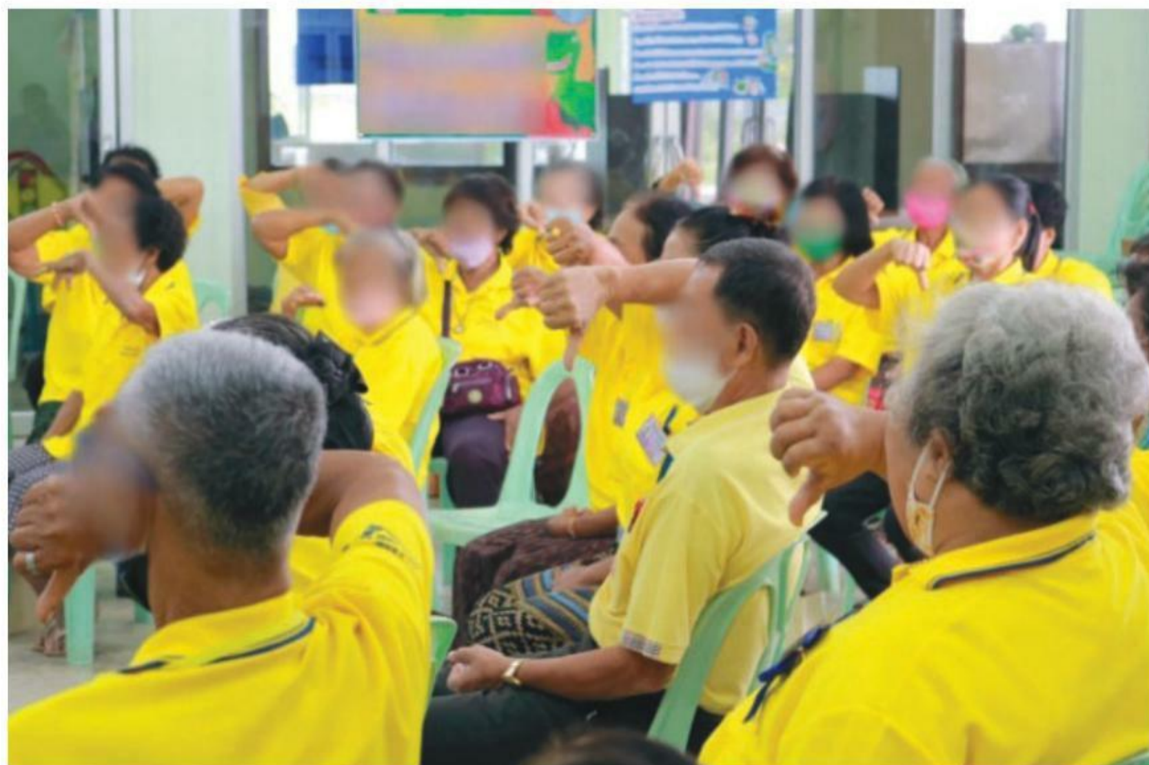
ภาพที่ 6 บรรยากาศของการจัดกิจกรรม

4.4 จากนั้น ผู้จัดกิจกรรมได้ให้ผู้สูงอายุทั้ง 2 กลุ่ม ที่ร้องในทำนองหลัก และ ทำนองประสาน ทำการออกแบบท่าทางการเคลื่อนไหว การรำ หรือการเต้น ให้สอดคล้อง กับความหมายของบทเพลง ทำนอง และจังหวะของบทเพลงที่ร้อง ซึ่งทำให้เกิดกระบวนการ สร้างสรรค์ออกแบบท่าทางการเคลื่อนไหวด้วยตนเอง และเป็นกระบวนการของการแข่งขัน แบบเกม ซึ่งแต่ละกลุ่มจะต้องออกมาสาธิตท่าทางการรำหรือการเคลื่อนไหวเป็นตัวอย่าง และทำการฝึกฝนท่าทางการรำรำในแต่ละกลุ่ม และนำมาประชันกันจนทำให้เกิดความ สนุกสนานในระหว่างการทำกิจกรรม ดังภาพต่อไปนี้