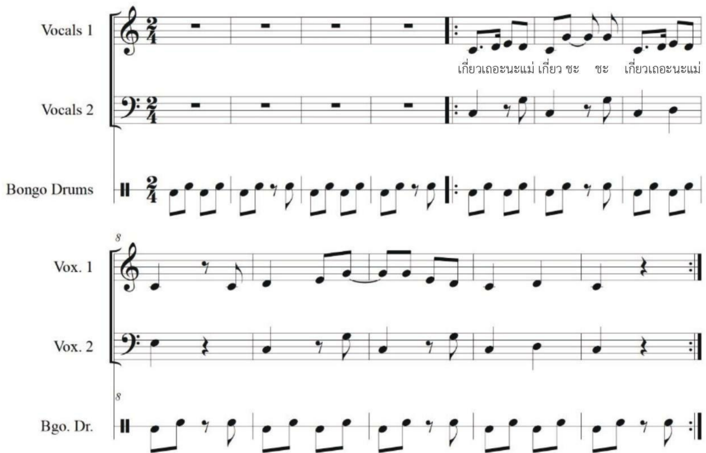
ภาพที่ 8 ตัวอย่างทำนองบทเพลงเกี่ยวข้าว

ดังนั้น จากแนวทำนองประสานที่ออกแบบขึ้น โดยนำไปใช้ในการขับร้องประสาน เสียงในทำนองเพลงลอยกระทง ซึ่งแนวทำนองประสานดังกล่าว สามารถนำไปใช้ในการร้อง ประสานในบทเพลงอื่นๆ ได้อีก โดยยกตัวอย่างในบทเพลงเกี่ยวข้าว โดยมีรูปแบบของ บทเพลงดังนี้