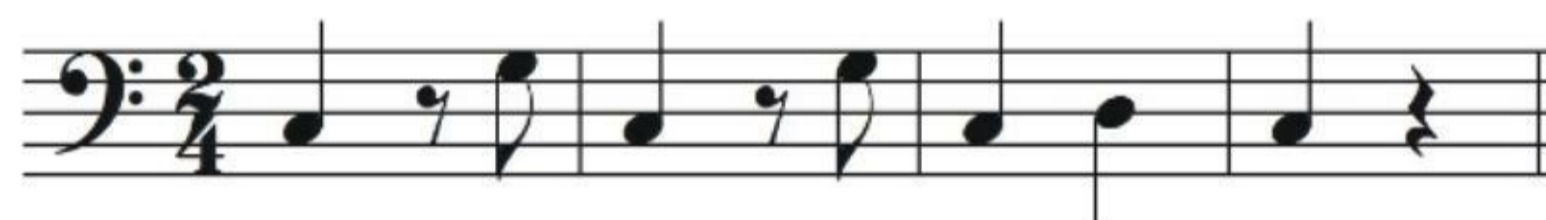
ภาพที่ 3 รูปแบบทำนองในแนวประสานในวลีที่ 2

จากภาพที่ 2 และ 3 เป็นแนวเสียงเบสเป็นแนวประสาน ที่สามารถนำมาใช้ในการประสานกับแนวเสียงของทำนองหลัก (Melody) ได้ของทำนองประสานแนวเบสที่ใช้ระดับเสียงโน้ตเพียง 5 ตัว อยู่บนพื้นฐานของบันไดเสียงเพนทาโทนิค ซึ่งมีลักษณะของระดับเสียงโน้ตที่แตกต่างกันเพียงโน้ตตัวสุดท้าย ดังนี้